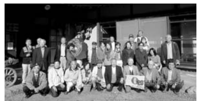
たかむろ水光園庭園