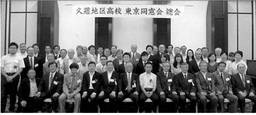
久慈地区高校 東京同窓会 総会

久慈地区高校東京同窓会の集いは母校、同窓会本部、行政関係、都内友好同窓会及び本会員より例年に勝るご賛同を得て盛会に終わりました。母校が生まれ変わって10周年になりました。同窓会は時代が変わっても精神及び培った学問を通じた仲間が親交を深めています。近年の就職難や生活不安はまだ払拭されず、個人的には対応が難しいです。パワフルな生活には色々の情報を話し、助け合いま