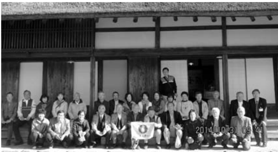
遠野ふるさと村の曲がり家前