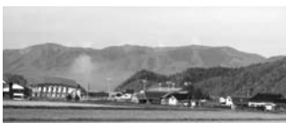
遠野市晩秋の田園風景