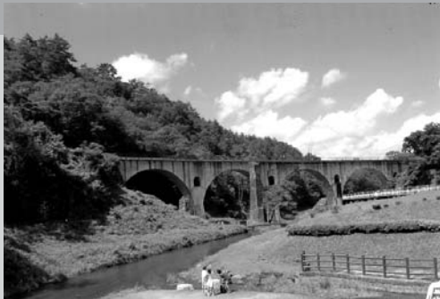
(SL 銀河鉄道メカネ橋)