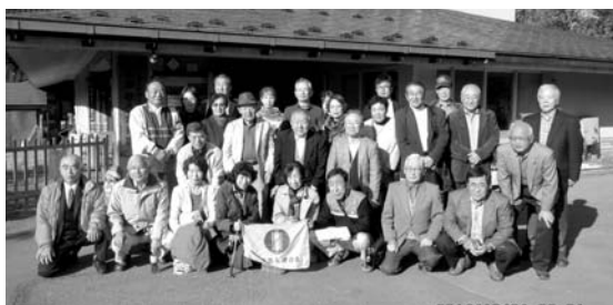
たかむろ水光園前