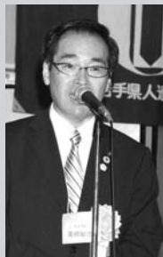
▲ 高橋敏彦北上市長