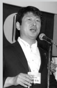
▲ 橋本英教衆議院議員