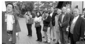
一ノ関市「世嬉の一酒造」