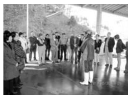
大船渡市小石浜市場