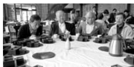
「世嬉の一酒造」で餅御膳の昼食