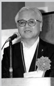
▲ 黄川田徹衆議院議員