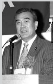
▲ 主浜了参議院議員