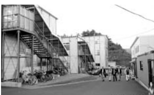
仮設の陸前高田市庁舎