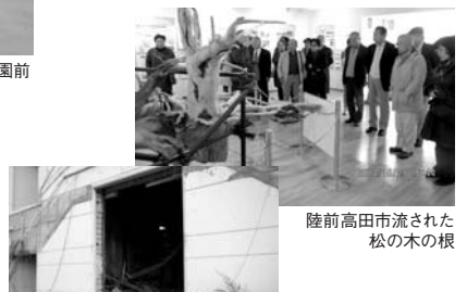
陸前高田市流された松の木の根