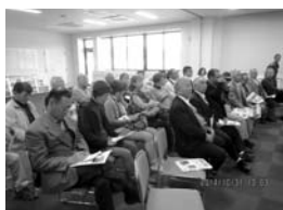
遠野市総合防災センター