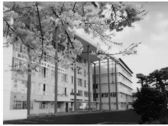
母校の発展のため支援させて頂きます。

学・短大・専門学校と公務員、地元企業への就職との事です。これから母校の発展のため支援させて頂きます。