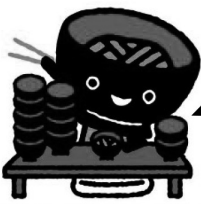
岩手県イメージキャラクター「そばっちゃん」