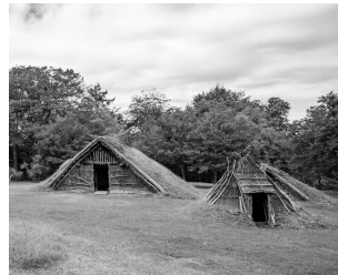
様子を知らずで貴重な遺跡です。「世界遺産のある町」にふさわしい魅力ある町を期待しています。

有名です。遺跡にはこの調査結果に基づいてできる限り正確に建物を復元しています。また、大規模なムラには、配石遺構を中心に東、中央、西に三つの集落が計画的に配置されており、御所野遺跡は縄文時代の社会の