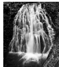
師匠「鱗滝左近次」と名前が同じというところで話題になり、ファンが訪れる人気のスポットとなっているそうです。

二戸市浄土寺町にある「うろこ滝」は、自然の岩肌を流れる約7mの落水由来だそう。八戸自動車道浄土寺インターチェンジを降り、県道二戸五日市線の浄土寺バイパスを八幡平市方面に約2.7km直進すると見えてくる「うろこ滝」の看板が目印です。その看板を左折し、約200mの山あいにあるうろこ滝は、案内板や歩道も整備され、こぢんまりとした場所として観光名所となっています。最近人気漫画「鬼滅の刃」の主人公竈門炭治郎の